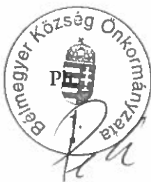
Perecz Sándor Polgármester